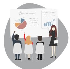
Salles équipées avec vidéoprojecteur