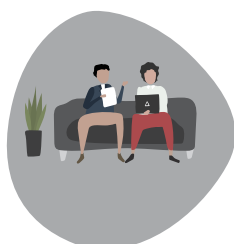
Possibilité de déjeuner sur place ou dans l'environnement proche