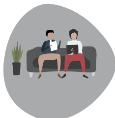
Possibilité de déjeuner sur place ou dans l'environnement proche